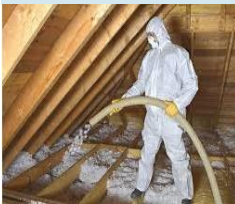
Isolation des combles perdus par soufflage

Toutes les configurations de toiture, peuvent être traitées avec des solutions d'isolation adaptées selon : les caractéristiques du comble à isoler, la conformité de la solution avec les exigences de performances thermiques et l'usage que l'on vise pour le comble.