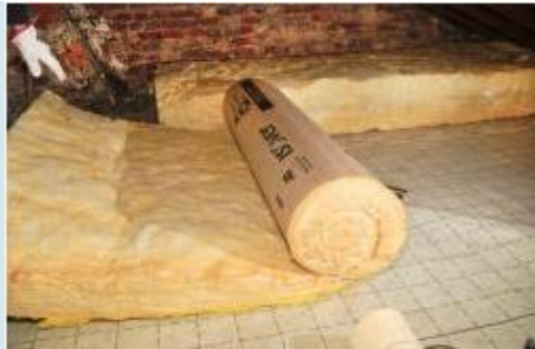
Isolation de comble perdu par rouleau